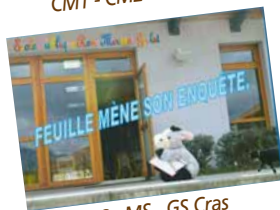
PS - MS - GS Cras

Livres réalisés par les communes participantes