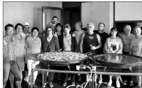
● Tous autour d'une magnifique paella.

Nos manifestations sont terminées pour ce début d'année 2015 avec beaucoup de bons moments partagés avec vous.