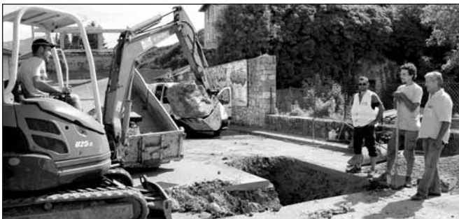
● Lors de l'intervention de la régie.

Suite à une grosse fuite d'eau survenue jeudi 25 juin en début d'après midi, le maire Bernard Fournier a dû intervenir rapidement pour mettre en place un plan de déviation pour tous les camions qui devaient se rendre à la carrière Balthazard et Cotte. En effet c'est en plein centre