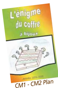
CM1 - CM2 Plan