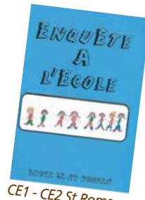
CE1 - CE2 St Romans

Site internet de la commune : http://polienas.sud-gresivaudan.org/