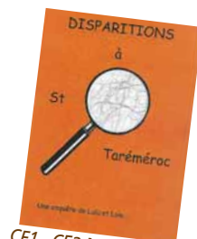
CE1 - CE2 Morette