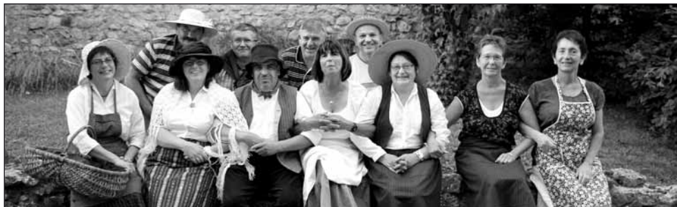
● Les membres du comité des fêtes en tenue d'époque.