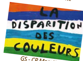
GS - CP Morette

Livres réalisés par les communes participantes