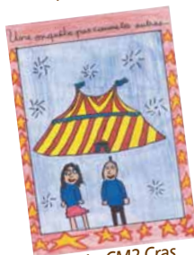
CM1 - CM2 Cras