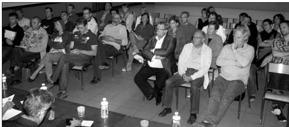
● Les élus des communes de Montaud, Poliéas, Quincieu et Serre-Nerpol.