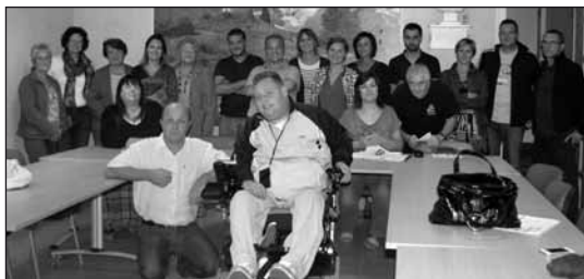
● Elus et responsables des associations locales.

Ci-dessous le programme établi jusqu'en janvier 2015.