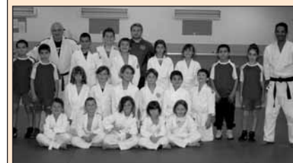
● Le groupe d'enfants ayant participé au stage et leurs professeurs.