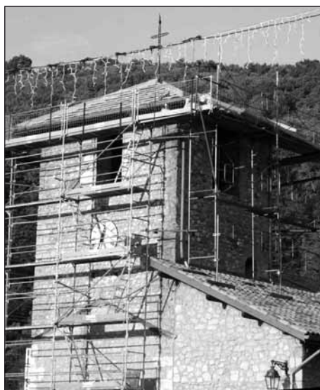
● L'échafaudage nécessaire pour les travaux.

Les travaux se sont poursuivis tout au long de ces derniers mois. Après la réfection de la toiture de l'église Saint-Jean-Baptiste, ce fut au tour du clocher. Changement de la charpente et des tuiles. Ces travaux ont été confiés à l'entreprise Finot-Jaquemet de Vinay. Les services techniques ont, quant à eux changer les tuiles sur le bâtiment des toilettes. Ils ont également réalisé l'aménagement des jeux de la cour de l'école : traçage de jeux, réalisations de bac à sable. Ils ont également démonté une des cheminées se trouvant sur le toit de la mairie. Les travaux de mise en sécurité de la traversée du village se sont achevés avec le