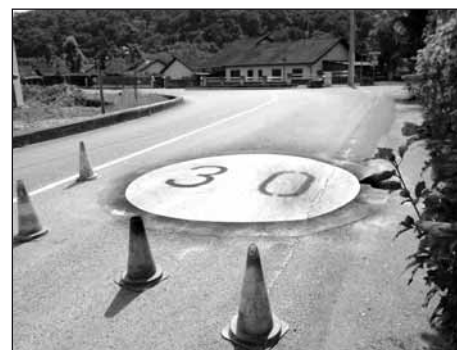
● Traçage au sol.

traçage au sol des délimitations de vitesse et des passages protégés. Un abri pour le matériel scolaire des tout